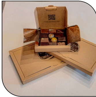
COFFRET DE CHOCOLAT

Assortiment de nos produits présenté dans une valisette cadeau