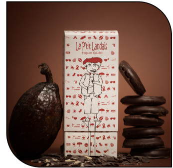
LE P'TIT LANDAIS

Coffret de 125gr, 250gr, 375gr ou 500gr. Garni de praliné, de ganache ou de caramel au fruit, enrobage chocolat noir ou lait